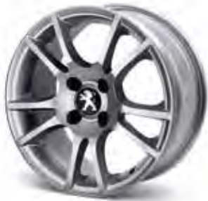
16" Aluminiumfälg Veleno