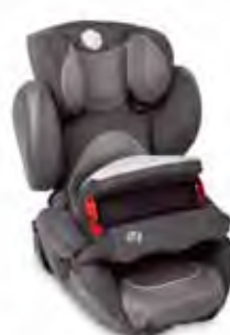
Kiddy Comfort Pro Grupp: 1, 2, 3

Stol för lite större barn i åldern 4–12 år/15–36 kg. Fästs i bilens Isofix-beslag. Ställs in för viloställning med hjälp av ett beslag i stolsryggen. Lättmanövrerat huvudstöd.