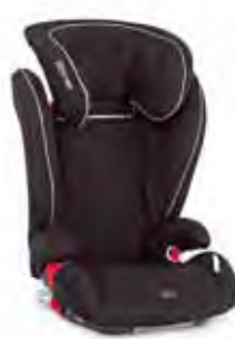
Römer Kidfix Grupp: 2, 3

Bakåtvänd stol för barn upp till 13 kg. Stolen skyddar barnet optimalt under körningen. Levereras med säkerhetshandtag, inställbar solskärm, huvudstöd och kudde för nyfödda.