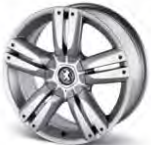
18" Aluminiumfälg Oxalis