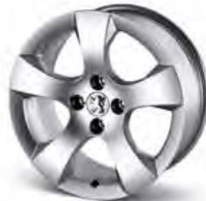
17" Aluminiumfälg Savara