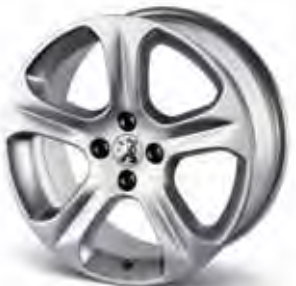
18" Aluminiumfälg Exona