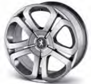
17" Aluminiumfälg Galium