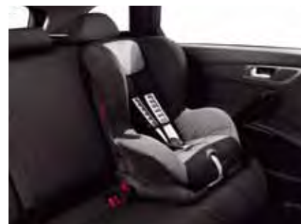
Römer Duo + 3-punkts Isofix Grupp: 1

Kiddy Comfort Pro är en synnerligen flexibel barnstol som passar för alla relevanta åldersgrupper. Monteras på ett ögonblick med snabb och praktisk fästordning som minskar risken för felaktig installation