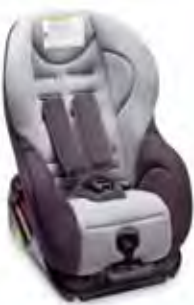
Fair G0/1 Isofix Grupp: 0, 1

Lättanvänd parkeringssensor, ett originaltillbehör som utvecklats särskilt för Peugeot. Fyra sensorer monterade i stötfångarna (kan lackeras i bilens färg). Perfekt vid fickparkeringar i city. Fram respektive bak.