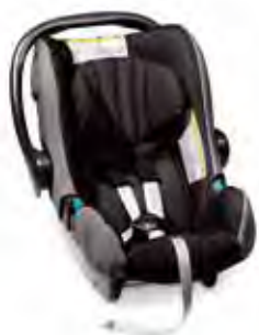
Römer Baby Safe + Grupp: 0+

Fair Isofix är en säker barnstol med många monteringsmöjligheter, bland annat Isofix. Barnet späns fast med ett invändigt fempunktsbälte. Djupt skålade sidor för bästa skydd och sovkomfort. För barn upp till 18 kg