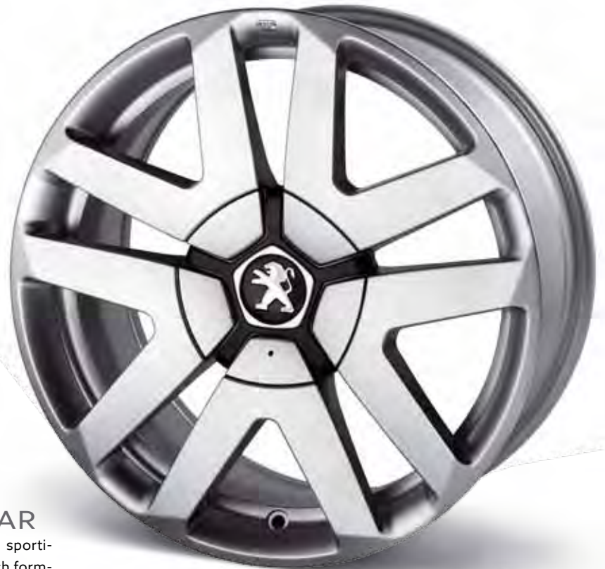
17" Aluminiumfälg Olis