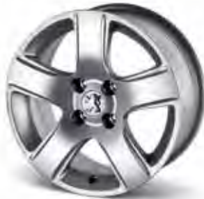
16" Aluminiumfälg Isara