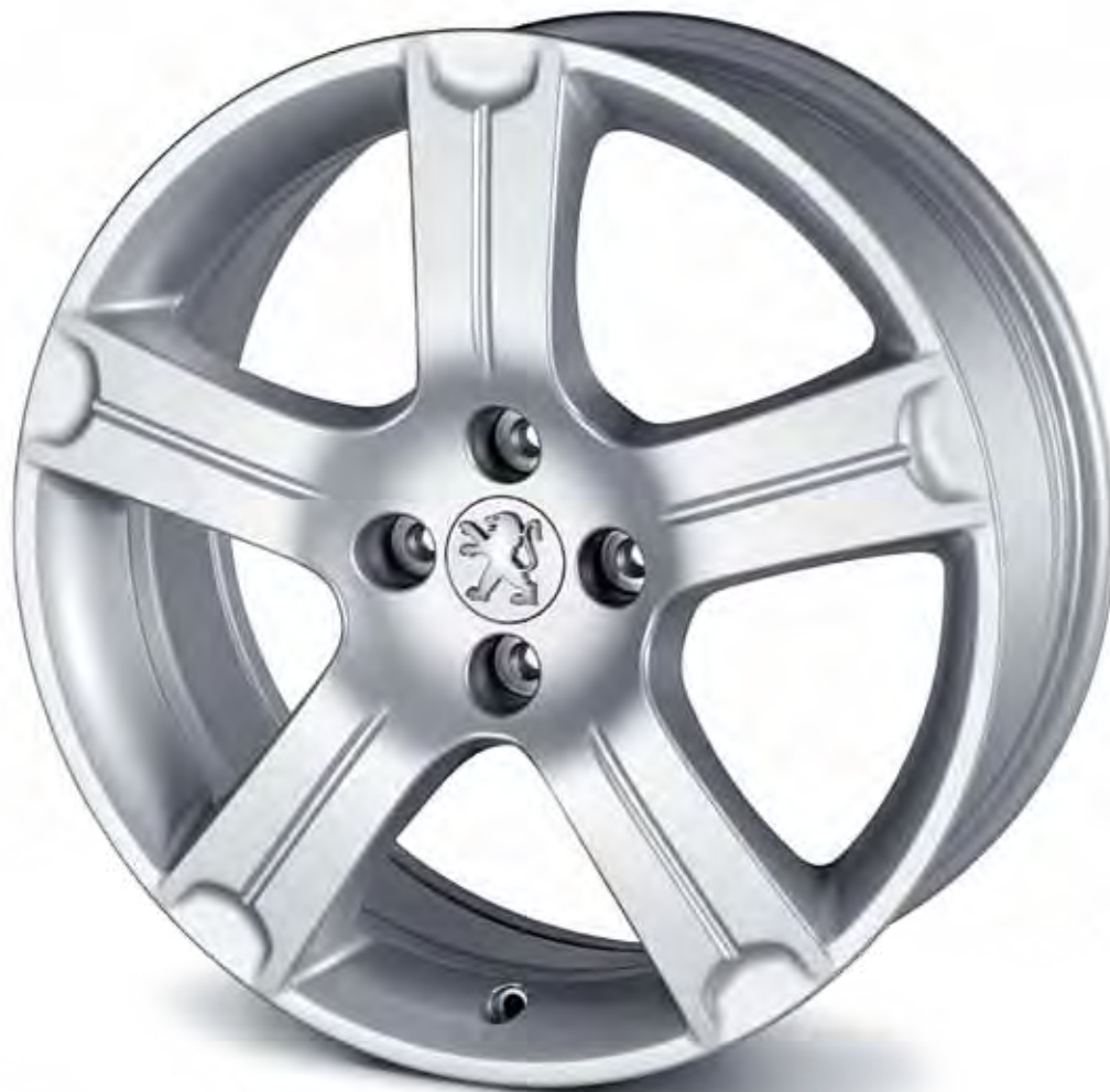
18" Aluminiumfälg Cereus