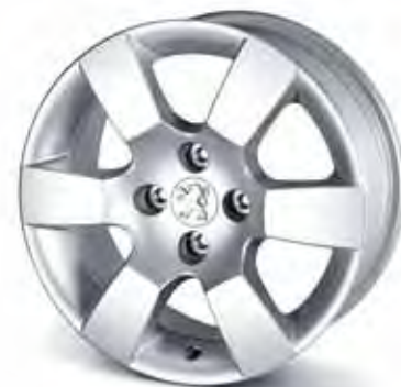
16" Aluminiumfälg Eris