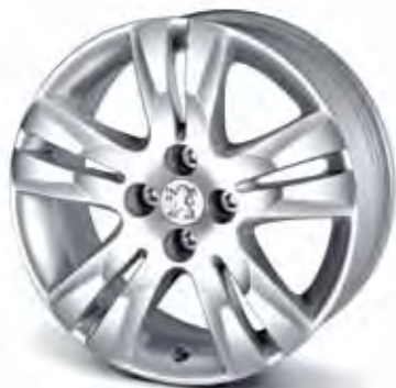
17" Aluminiumfälg Quark