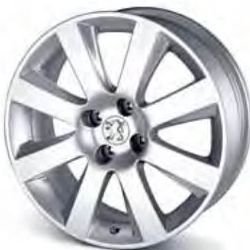
18" Aluminiumfälg Magnetik