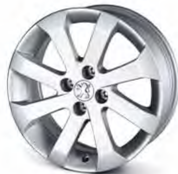
17" Aluminiumfälg Abellia